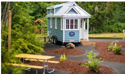
So baut man ein Tiny House