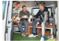
Möbelsystem für Vans und Kombis

Auch das Flexboard kann zum Selbsteinbau bestellt werden und kostet 380 Euro. Die Sitzbank aus 22 mm dicker Birke mit 6 Füßen und Kopfteil dient tagsüber als Sitzgelegenheit und nachts als Bett. Die beiden Polster haben eine Anti-Ruck-Unterseite, die Matratze besteht aus Kaltschaum. Form und Höhe der Bank kann ans Auto angepasst werden.